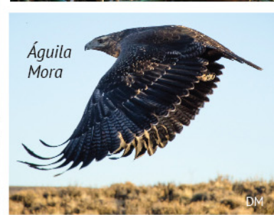
Águila Mora DM