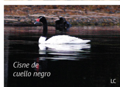
Cisne de cuello negro LC