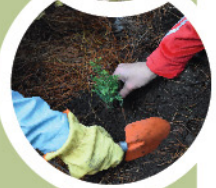
Laguna Los Alerces LC